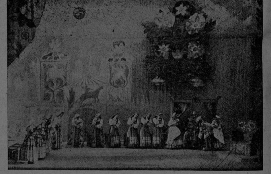
Escena del Ballet Coq d'or

Procedente de los Teatros Convent Garden, de Londres; Teatro de la Opera, de París; Metropolitan Opera House, de N. York; Teatro Colón de Buenos Aires. Y ahora, en nuestro país, en una